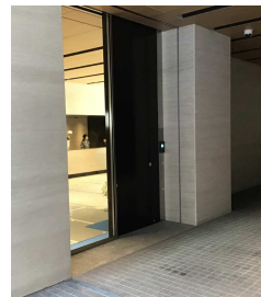
(B)裏手側入り口 自動